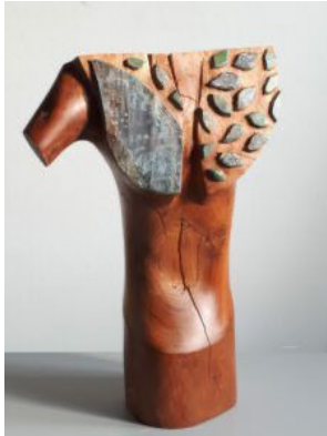
Hendrien Landeweer, beelden

29 april t/m 22 mei open dinsdag, woensdag, donderdag van 11.00 – 16.00 uur